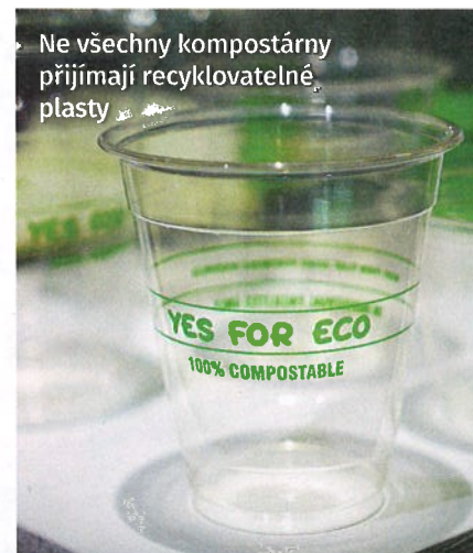
Ne všechny kompostárny přijímají recyklovatelné plasty

Nevýhodou komunálního svozu je ovšem to, že přijdeme o cennou část celého procesu – o samotný kompost. Jako druhá varianta se tak ve městě