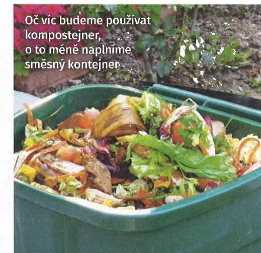
Oč víc budeme používat kompostejner, o to méně naplníme směsný kontejner